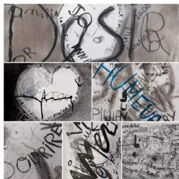
Printemps des poètes 2021, réalisation par les 5ème de collège « Albert Camus » à Brunoy (91800)

T. 03 84 75 87 87 E. ad70@occe.copp Site. www.occe.coop/ad70 5 rte de St Loup 70 000 VESOUL