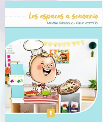
Mélanie Rambaud, Les espaces à scénarios, Éditions Sésames

« Trame pour l'exploitation d'un espace à scénario »