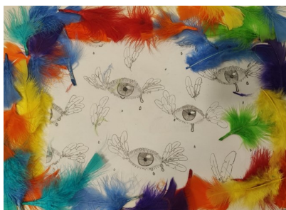
6ème du collège « Antoine de Saint Exupéry » à Hellemmes (59260) - Printemps des poètes 2024

« La bonne grâce est le vrai don des fées : Sans elle, on ne peut rien, Avec elle, on peut tout » Charles Perrault (1628-1703) Cendrillon